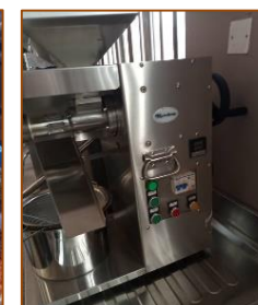
Pressa per olio di caffè

Il progetto si è concluso con l'acquisto della macchina per spolare/decorticare il caffè e la pressa per produrre olio di caffè. Al momento sono state posizionate sotto una tettoia ma è necessario realizzare un MAGAZZINO per collocarle in modo sicuro. L'attività di formazione da parte dei contadini Trainers (formatori) sta continuando nei vari villaggi e si sta innescando un processo virtuoso di mutuo-aiuto tra i coltivatori di caffè. Le piante madri continuano a crescere ed è iniziata la preparazione del vivaio dove verranno collocate le nuove piantine. Il processo di riproduzione andrà avanti per diversi anni e saranno generate migliaia di nuove piante.