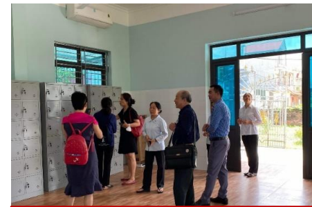
Interno del nuovo centro di riabilitazione

Il progetto prosegue come previsto. Si è svolto il corso di formazione degli operatori socio-sanitari; sono state acquistate le attrezzature per la riabilitazione ed anche 6 motociclette che saranno preziose per recarsi nei villaggi per le attività di sensibilizzazione, educazione e supporto alle famiglie con disabili. Inoltre, sono stati consegnati due pc portatili che ci sono stati donati, tramite Don Sergio Vandini, dall'azienda COM-TEL_Computer & Telematica di Terni.